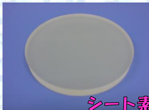
シート素材より加工