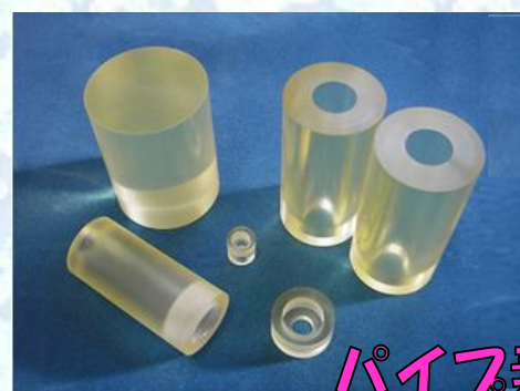
パイプ素材より加工